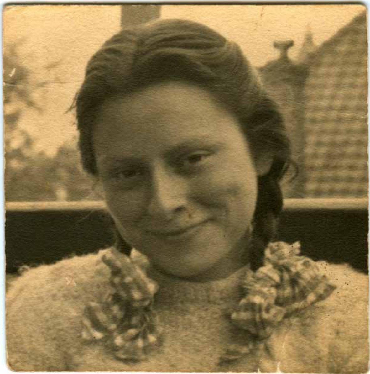
Freddie Oversteegen eind 1944